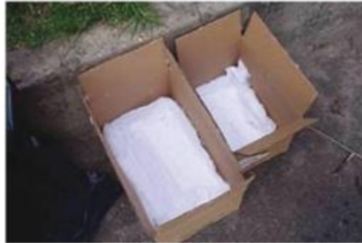
Fotografía 1 Ejemplo caja para transporte de avifauna

En caso de no poder llevar los huevos o polluelos rescatados de forma inmediata al lugar de reubicación, es necesario brindar condiciones de alimentación y pernoctación. Para esto, se puede preparar una mezcla de frutas, las cuales se deben picar en pequeños trozos. Entre las frutas recomendadas están: papaya, mango, banano y guayaba. También es importante mantener alpiste para alimentar a los polluelos juveniles. Otros alimentos que se pueden suministrar son lombrices de tierra y/o larvas de tenebrios como fuente de proteína.